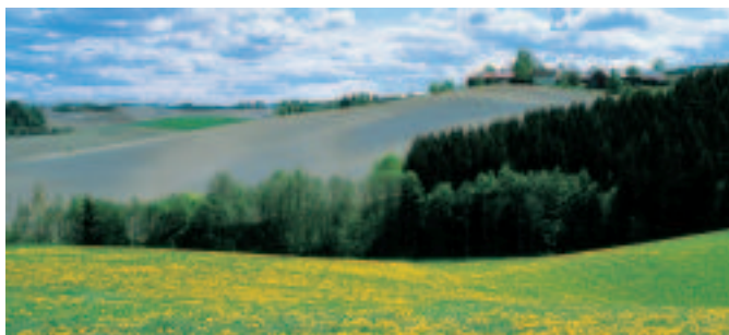
&gt; REGION ØST