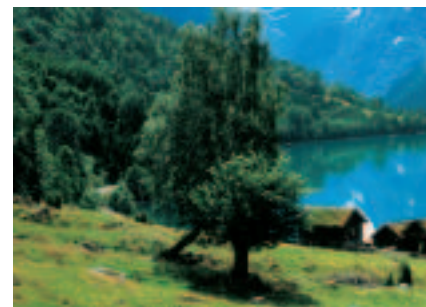
&gt; REGION VEST